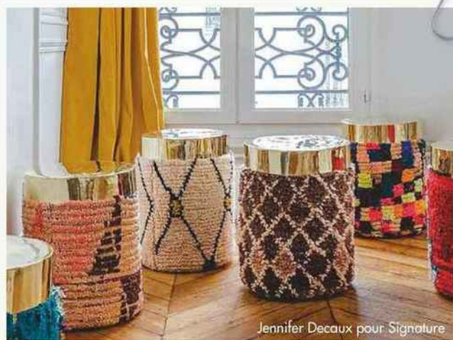
Jennifer Decaux pour Signature