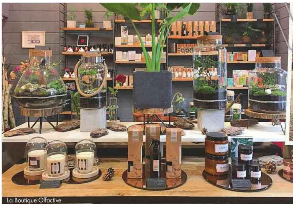
La Boutique Olfactive